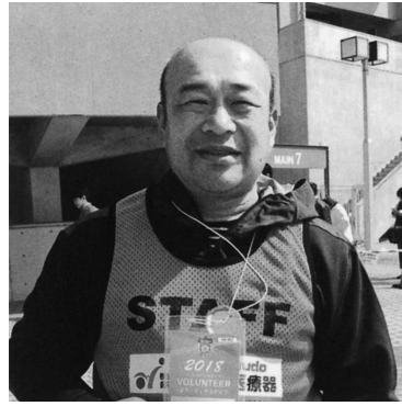
カマタマーレ讃岐を中心に活躍されているボランティアキャストの方

● ボランティアを始めたきっかけは？ 会社でチケットをもらって観戦したとき、スポサポ香川の存在を知り、参加してみました。地元で頑張っているチームの役に立てればという気持ちで始めたのですが、今ではすっかりファンになっています。