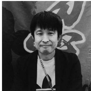
香川ファイブアローズを中心に活躍されているボランティアキャストの方

● 一言メッセージをお願いします！ 気軽な感じでぜひ一度参加してみてください。舞台裏を見られるのはワクワクもしますし、スポーツに興味がなくとも楽しめると思います。